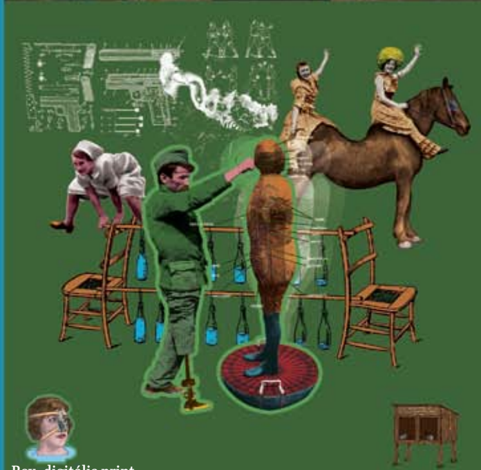
Box, digitális print