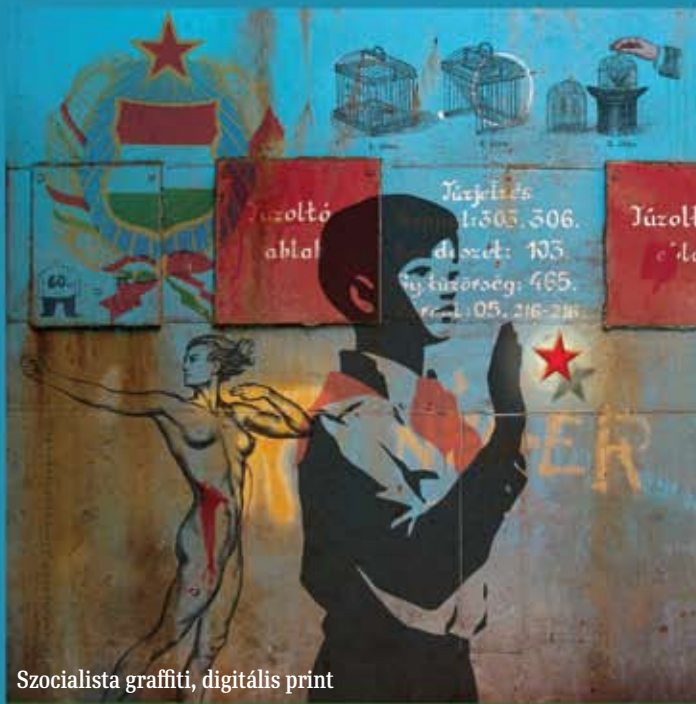
Szocialista graffití, digitális print