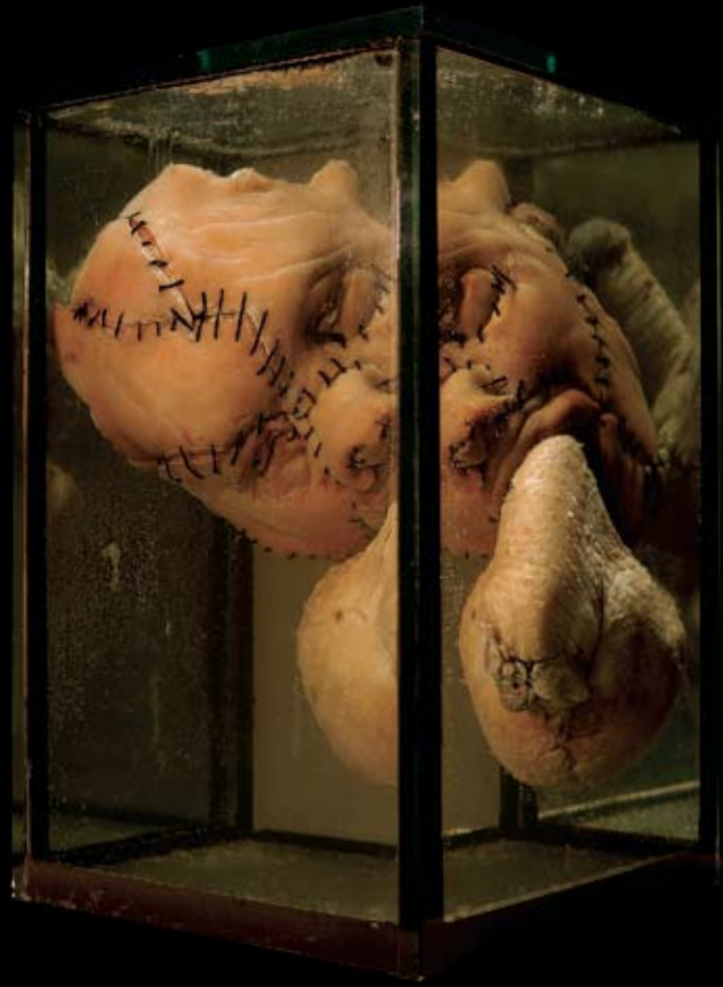
Homo oral, 2006, állati húsok, formaldehid, üveg, 45x30x20 cm