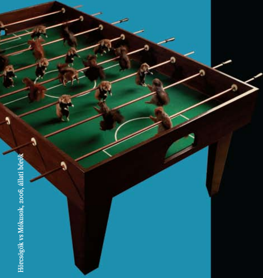
Hörcsögök vs Mókusok, 2006, állati bőrok