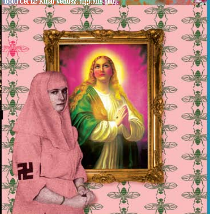
Légymintás tapéta, digitális print