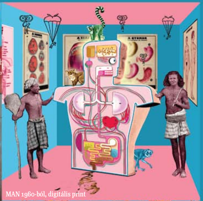
MAN 1960-ból, digitális print