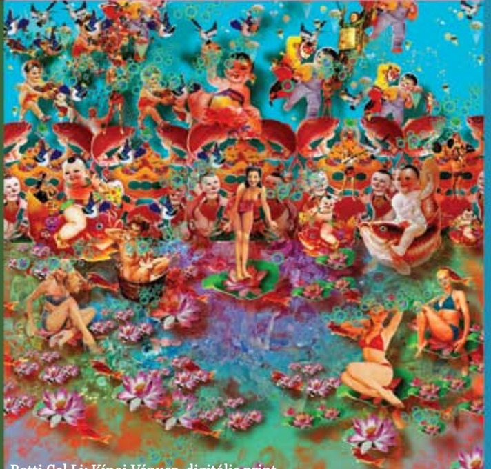
Botti Cel Li: Kínai Vénusz, digitális print