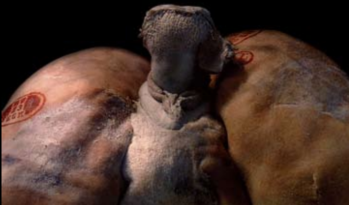
Hetero genital IV., 2007, állati húsok, formaldehid, üveg, 45x20x30 cm